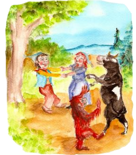
Kalline und der Riesentroll